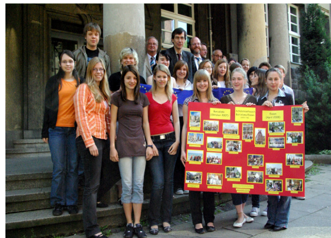
Besuch des Staatssekretärs, Herrn Winands anlässlich des Europatages